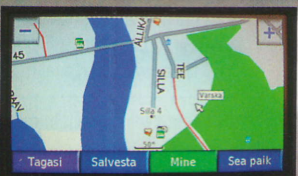
Regiole polnud Värskas Silla 4 leidmine mingi probleem.