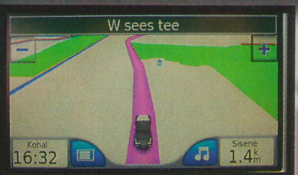
Regio näitab talukohta vaid majakujulise ikooniga.