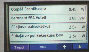
E.O.MAP-i huvipunktid piirdub sageli hotellide ja muuga.