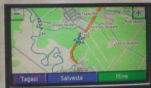
E.O.MAP kuvab linnast väljas ekraanile rohkem teavet.