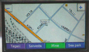
E.O.MAP-i info piirdub vaid suuremate tänavatega.