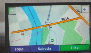
E.O.MAP leidis vaid Silla tänava, maja enam mitte.