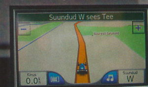
E.O.MAP kuvab talu nime aga otse ekraanile.