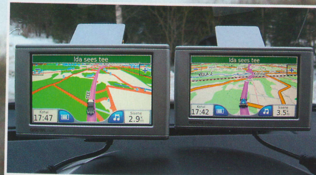
Parempoolne E.O.MAP on informatiivsem, kuid vasakpoolne Regio toob selgemalt esile teed, mida mööda on võimalik autoga sõita.